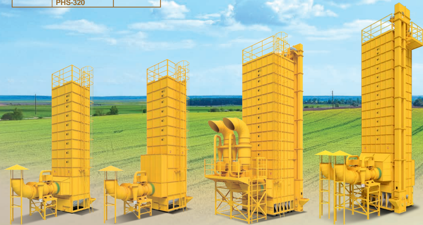
NEW PRO-120H +CL-10H臥式