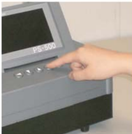
押下平均值按鈕 計算平均值